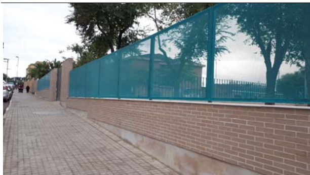
CEIP ANTONIO MACHADO