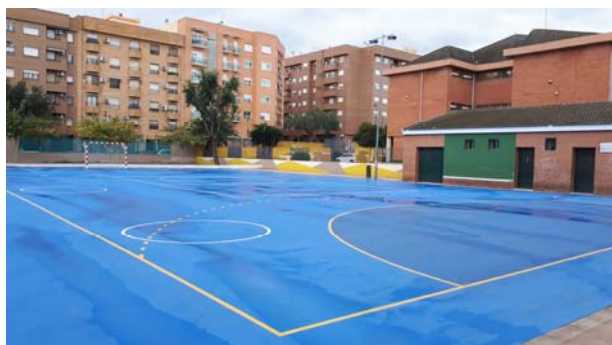
CEIP EL MOLÍ